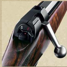
Spannen: Spannhebel auf Position "Fire"

Kaliberwechsel: Durch Laufwechsel kann das Kaliber der Waffe variiert werden. Beim Wechsel in eine andere Kalibergruppe wird auch der Verriegelungskopf (Abb.3) getauscht – im Handumdrehen und ohne Werkzeug.