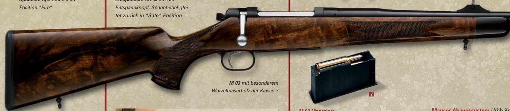
M 03 mit besonderem Wurzelmaserholz der Klasse 7

Wechselläufe (Abb.4): Zum Laufwechsel werden einfach zwei verlustsichere Befestigungsmuttern im Vorderschaft gelöst.