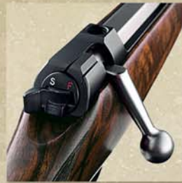
Entspannen: Druck auf den Entspannknopf, Spannhebel gleitet zurück in "Safe"-Position