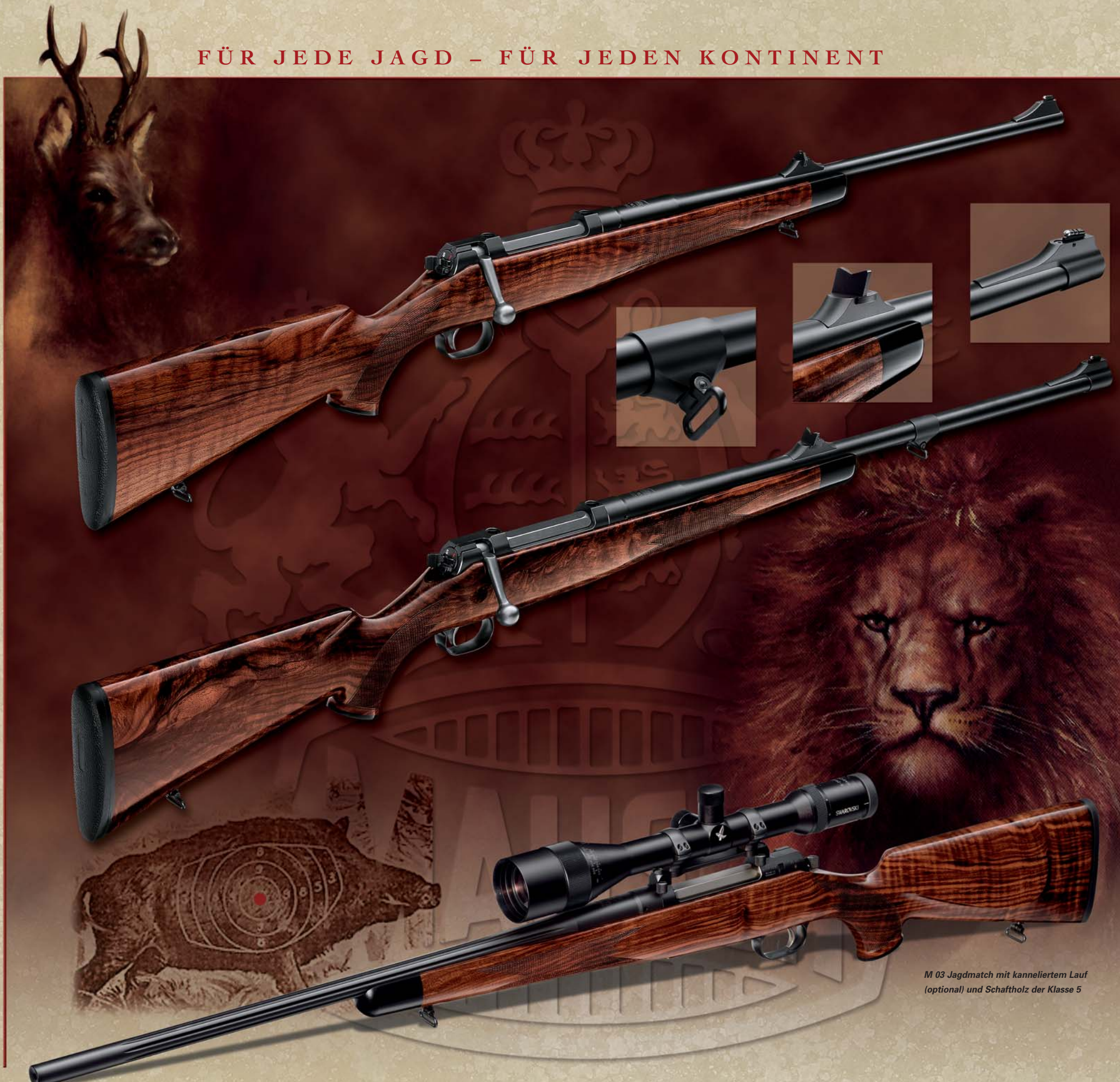
M 03 Jagdmatch mit kanneliertem Lauf (optional) und Schaftholz der Klasse 5

Jagdschützen mit Ambitionen für den sportlichen Wettbewerb nutzen die optimale Anschlagstabilität und das souveräne Schwingverhalten der M 03 Jagdmatch für beste Ergebnisse. Sie verbindet erstklassige Balance mit hervorragender Schussleistung. Auf Wunsch sorgt ein kannelierter Matchlauf für verbesserte Wärmeabgabe. M 03 Matchläufe sind auch als Wechselläufe erhältlich.